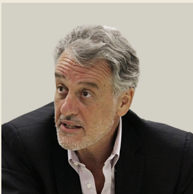
Του Λουκά Τσούκαλη Καθηγητή στο Πανεπιστήμιο Αθηνών και προέδρου του ΕΛΙΑΜΕΠ

“ Το επαναστατικό πείραμα της ευρωπαϊκής ενοποίησης περνά μια υπαρξιακή κρίση εδώ και μερικά χρόνια. Δυσμενείς αλλαγές στο εξωτερικό περιβάλλον ήρθαν να συναντήσουν τις εσωτερικές αδυναμίες της Ευρώπης και το αποτέλεσμα υπήρξε ιδιαίτερα επώδυνο. ”