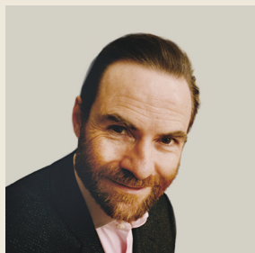
Του Τίμοθι Γκάρτον Ας Καθηγητή Ευρωπαϊκών Σπουδών στο Πανεπιστήμιο της Οξφόρδης

“ Η υποψήφια του Εθνικού Μετώπου έχει ταχθεί υπέρ της διεξαγωγής δημοψηφίσματος για την παραμονή της Γαλλίας στην Ε.Ε. «Δεν φοβάμαι τον λαό», λέει. Δηλώνει emphaticά ότι θα διοργανώσει το δημοψήφισμα και θα σεβαστεί το αποτέλεσμα. ”