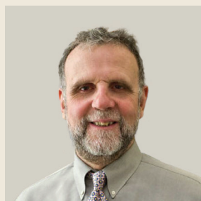
Του Γιάννη Ιωαννίδη Καθηγητή Οικονομικών στο Πανεπιστήμιο Tufts

“ Η ουσιαστική προϋπόθεση για έξοδο της χώρας από την κρίση είναι μία: η Ελλάδα πρέπει να επενδύσει μαζικά σε υλικό κεφάλαιο και ανθρώπινους πόρους, πράγματα που γίνονται μόνο με βαθιές μεταρρυθμίσεις που μόνο πολιτική σύμπνοια και συναίνεση μπορούν να εξασφαλίσουν. ”