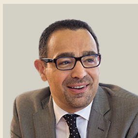
Του Βολφάνγκο Πικολί Συν-προέδρου της Teneo Intelligence

“ Ο ρυθμός ανάπτυξης της οικονομίας προβλέπεται ότι θα επιβραδυνθεί σημαντικά το 2017. Οι ανησυχίες για μια βαθιά ύφεση έχουν ενταθεί – και θα γίνουν ακόμα εντονότερες αν συνεχιστούν η πολιτική αστάθεια, οι εκκαθαρίσεις, οι μαζικές συλλήψεις και οι απαλλοτριώσεις εταιρειών από το κράτος. ”