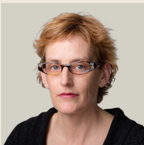
Της Τζούντιθ Σάντερλαντ Διευθύντριας Ευρώπης και Κεντρικής Ασίας της Human Rights Watch

“ Η Ύπατη Αρμοστεία του ΟΗΕ για τους Πρόσφυγες εκτιμά ότι 1,19 εκατομμύρια πρόσφυγες θα χρειαστούν μετεγκατάσταση το 2017, αλλά δεν προσδοκά ότι θα μπορέσει να καλύψει πάνω από 170.000 συνολικά. ”