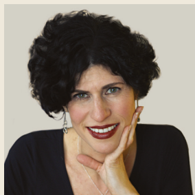
Της Τζουλιέτ Αϊλπεριν Επικεφαλής Γραφείου Λευκού Οίκου The Washington Post

“Θα δώσουμε τον καλύτερό μας εαυτό τους ερχόμενους μήνες και χρόνια για να εστιάσουμε στις πιο σημαντικές ιστορίες, που θα καθορίσουν τις πραγματικές συνέπειες της πολιτικής της νέας αμερικανικής κυβέρνησης. Αυτή είναι η δουλειά μας, μια ιερή αποστολή σε αυτούς τους χαοτικούς καιρούς.”