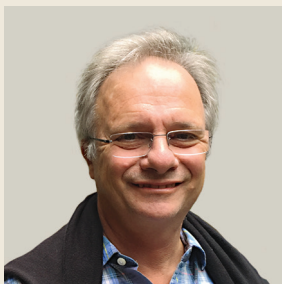
Του Κώστα Μεγρή Καθηγητή Οικονομικών στο Πανεπιστήμιο Yale

“ Το ελληνικό κράτος, με τα τεράστια ρυθμιστικά και φορολογικά βάρη που επιβάλλει, επιδοτεί την παραοικονομία. Είναι εξαιρετικά δύσκολο για μια επιχείρηση να επιβιώσει αν συμμορφώνεται πλήρως με τη νομοθεσία. ”