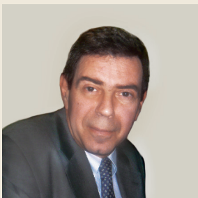
Του Κώστα Κωστή Ιστορικού, Καθηγητή του Πανεπιστημίου Αθηνών

“ Δεν έχουμε ξαναζήσει καταστάσεις όπως η σημερινή και οι ομοιότητες δεν είναι αρκετές για να οδηγήσουν σε επαναλαμβανόμενα μοτίβα. Το παρελθόν δεν μπορεί και δεν πρόκειται να βοηθήσει κανέναν να αλλάξει μια καθοδική πορεία, η οποία φαίνεται ότι δεν έχει τέλος. ”