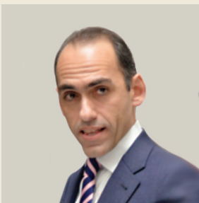
Του Χάρη Γεωργιάδη Υπουργού Οικονομικών της Κυπριακής Δημοκρατίας

“ Μπορέσαμε να ολοκληρώσουμε το Μνημόνιο χωρίς κανέναν νέο φόρο. Κατ’ ακρίβεια, προωθήσαμε σημαντικές φορολογικές ελαφρύνσεις και δώσαμε ώθηση στην πραγματική οικονομία. Η κυπριακή οικονομία αναπτύσσεται πλέον με ρυθμό κοντά στο 3% του ΑΕΠ και η ανεργία άρχισε να μειώνεται. ”