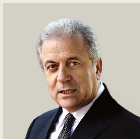
Του Δημήτρη Αβραμόπουλου Επιτρόπου Μετανάστευσης, Εσωτερικών Υποθέσεων και Ιθαγένειας της Ε.Ε.

“ Σήμερα η Ευρώπη βρίσκεται μπροστά σε μια υπαρξιακή κρίση. Η γενιά που τη δημιούργησε, η οποία ήταν εκείνη που βίωσε το δράμα δύο παγκόσμιων πολέμων, δεν υπάρχει πια. Οι νεότερες γενιές θεωρούν τις μεγάλες κατακτήσεις της Ενωμένης Ευρώπης δεδομένες. ”