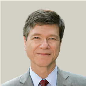
Του Τζέφρι Σακς Διευθυντή του Earth Institute - Πανεπιστήμιο Columbia

“ Τόσο η Ευρώπη όσο και οι ΗΠΑ βλέπουν την παγκόσμια κυριαρχία τους να φθίνει, τόσο για δημογραφικούς όσο και για γεωπολιτικούς λόγους. Οι λαϊκιστές δεν γνωρίζουν Ιστορία ούτε τους ενδιαφέρει να μάθουν, αλλά εκμεταλλεύονται τους φόβους που προκαλούν αυτές οι βαθιές μακροϊστορικές τάσεις. ”