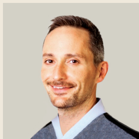
Του Τζον Φόουλι Αρχισυντάκτη Ευρωπαϊκών Θεμάτων Reuters Breakingviews

“ Το κόμμα της Νέας Δημοκρατίας, που ο ΣΥΡΙΖΑ έριξε από την εξουσία, προηγείται με διψήφια ποσοστά στις δημοσκοπήσεις. Αν ο πρωθυπουργός Αλέξης Τσίπρας προκηρύξει εκλογές μέσα στο 2017, πιθανότατα θα τις χάσει. Για φιλελεύθερους πολιτικούς που αντιμετωπίζουν ριζοσπάστες διεκδικητές της εξουσίας σε άλλες χώρες της Ευρώπης, αυτή η εξέλιξη είναι ενθαρρυντική. ”