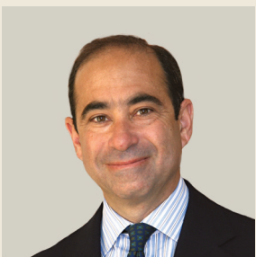
Του Ιαν Λέσερ

“ Η απεμπλοκή των ΗΠΑ από την ευρύτερη περιοχή είναι μάλλον απίθανη. Μπορεί μάλιστα να εμπλακούν εντονότερα, αν και αυτό μάλλον θα γίνει με πιο μονομερή τρόπο. ”