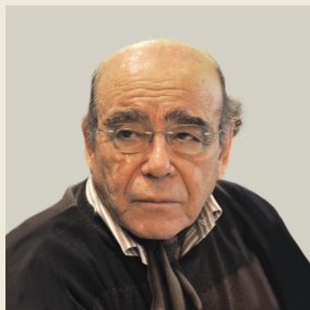
Του Θανάση Βαλτινού Συγγραφέα και Προέδρου της Ακαδημίας Αθηνών

“ Η αβεβαιότητά μας μάς κάνει σκεπτικιστές. Επιφυλακτικούς και κατά κάποιον τρόπο προληπτικούς. Τι θα μας φέρει αυτός ο καινούργιος χρόνος; Δεν είναι εύκολο να αρθρώσουμε υποθέσεις. Ούτε να δώσουμε σχήμα στους φόβους μας. ”