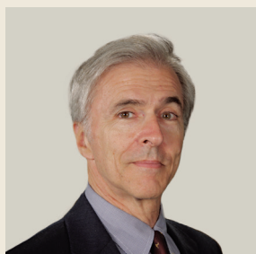
Του Πολ Μπλουστάιν Senior fellow του Center for International Governance Innovation

“ Το ένστικτό μου λέει ότι κατά το νέο έτος το ΔΝΤ θα βρει έναν τρόπο να ικανοποιήσει τις ανάγκες των Ευρωπαίων και θα συμμετάσχει στο πρόγραμμα, χωρίς κάποια συμφωνία για μεγαλύτερη ελάφρυνση του χρέους. Ίσως αποδειχθεί κρίσιμος παράγοντας η επιθυμία της γενικής διευθύντριας, Κριστίν Λαγκάρντ, να μη δημιουργήσει πολιτικά προβλήματα στην Άγκελα Μέρκελ. ”