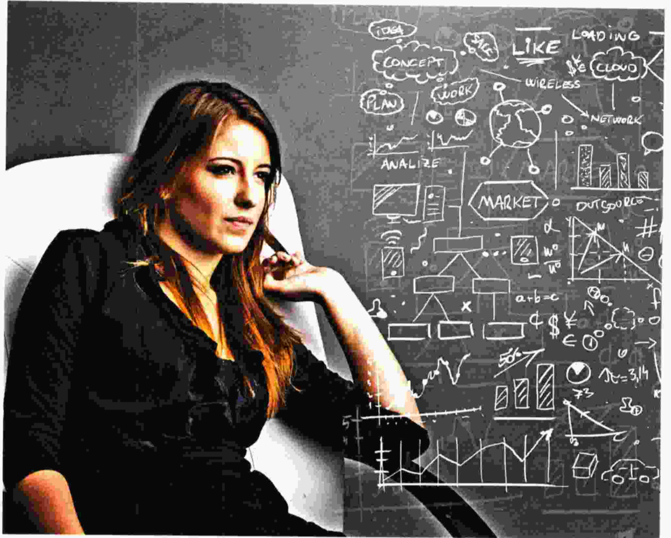
Ενίσχυση της γυναικείας επιχειρηματικότητας διαπιστώνει η έκθεση του ΙΟΒΕ

Επίσης, η συνέχιση των capital controls επηρεάζει πολύ τις επιχειρήσεις σε σχέση με τη χρηματοδότηση. Επιχειρήσεις οι οποίες είχαν δάνεια που τους δημιουργούσαν με τον ένα